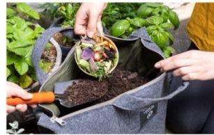
生ごみコンポスト体験