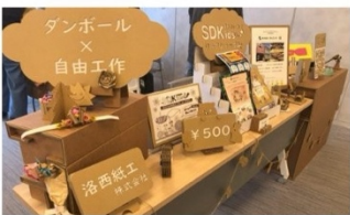
ダンボールアップサイクル