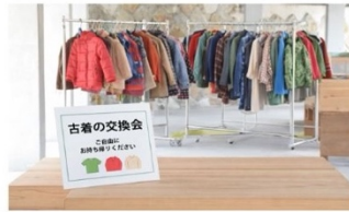
古着の回収 & 交換会