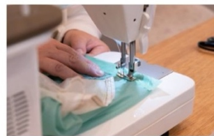
お直し・リペア体験