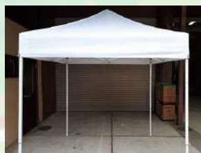
●レンタル白テント (1.8m×1.8m / 3m×3m)