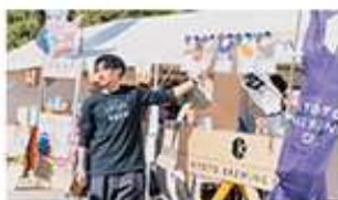
⑦ 京都クラフトビアエキスポ