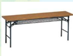
●長机（幅狭 or 幅広） (180cm × 45cm or 60cm)