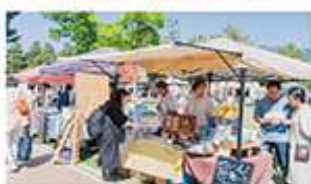
② 出展・出店ブース