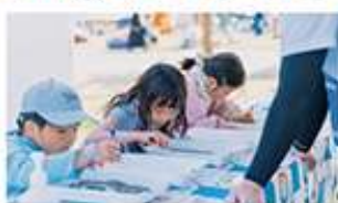
③ 体験・ワークショップ