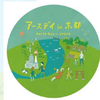
直径 15cm ステッカー